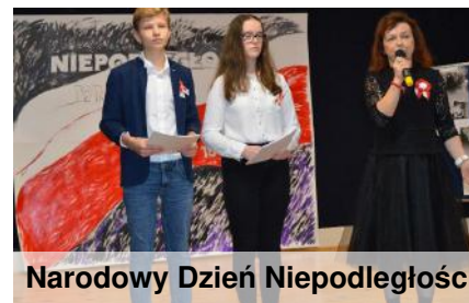
Narodowy Dzień Niepodległości