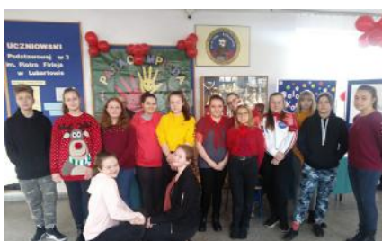
Grupa wolontariuszy zaangażowana w Paraolimpiadę