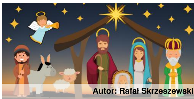
Autor: Rafał Skrzyszewski