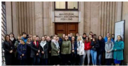
Aleja Szucha w stolicy