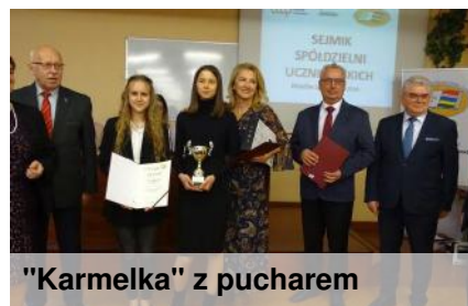
"Karmelka" z pucharem