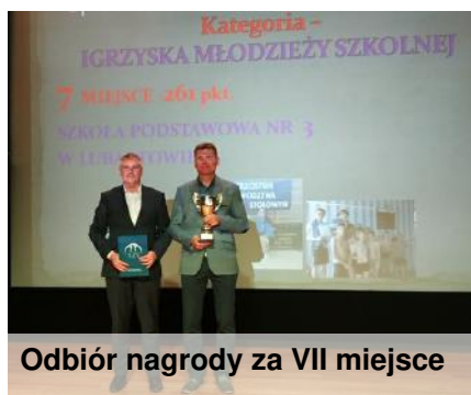
Odbiór nagrody za VII miejsce