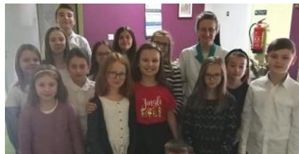
W hospicjum po występie