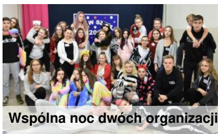
Wspólna noc dwóch organizacji