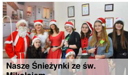
Nasze Śnieżynki ze św. Mikołajem