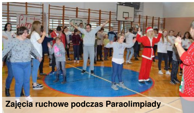
Zajęcia ruchowe podczas Paraolimpiady