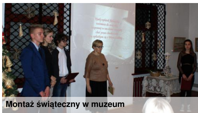
Montaż świąteczny w muzeum