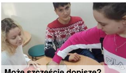
Może szczęście donisze?

23 listopada br. uczniowie klas IV-VI z naszej szkoły wzięli udział w grze miejskiej „W grodzie księcia Pawła Karola” zorganizowanej przez Lubartowskie Towarzystwo Regionalne i Muzeum Ziemi Lubartowskiej z okazji Imienin Miasta Lubartowa. Niektórzy uczniowie byli w muzeum po raz pierwszy i z zainteresowaniem zwiędzali aktualne wystawy.