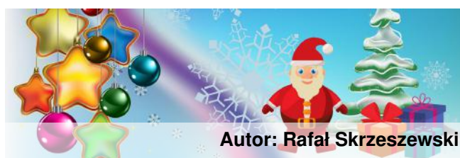
Autor: Rafał Skrzyszewski

Oprac. na podstawie Internetu: Krzysztof Bronisz, 5e